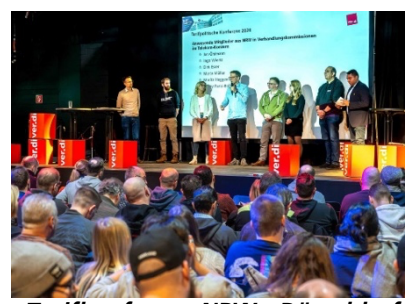
Tarifkonferenz NRW - Düsseldorf

Die Ergebnisse der Forderungsinterviews werden dokumentiert und zusammengefasst. Das daraus zusammengefasste Meinungsbild der Kolleginnen und Kollegen wird die Tarifkommission in ihrer Sitzung am 14. und 15. März analysieren und die Forderung zur Tarifrunde 2024 beschließen.