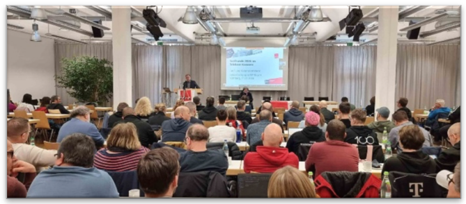
Tarifkonferenz Bayern - Nürnberg

Nutze DEINE Chance: Jetzt Mitdiskutieren und Mitentscheiden!