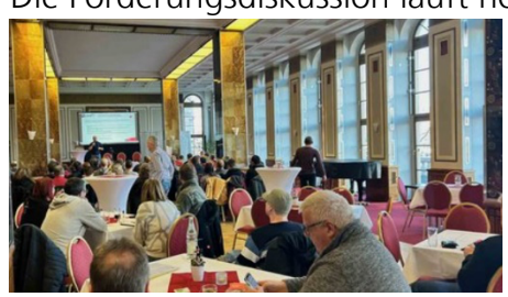
Tarifkonferenz SAT - Leipzig

Die Forderungsdiskussion läuft noch bis Ende Februar 2024 und gilt gleichermaßen für alle Mitglieder und Beschäftigten im Telekom-Konzern.