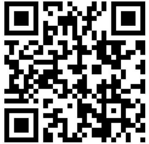
Digitaler Antrag auf Streikunterstützung

Die Streikerfassung erfolgt dann am Streiktag durch Abscannen, des individuellen QR-Codes, den du erhältst.