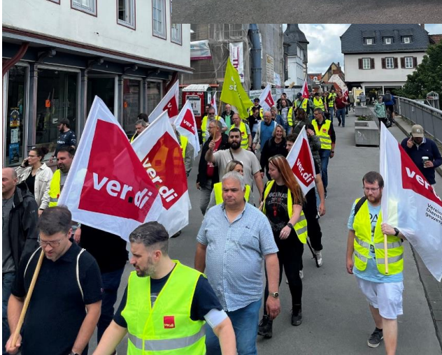
Der „Joker“ Bad Kreuznach, Foto: ver.di