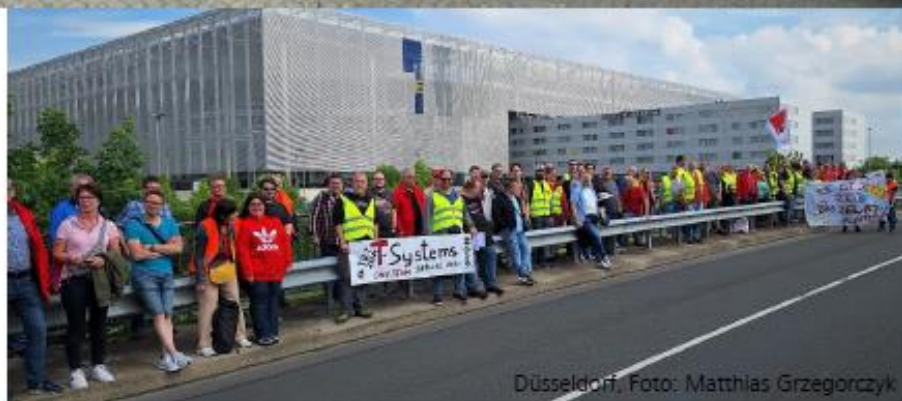
Düsseldorf, Foto: Matthias Grzegorzczak