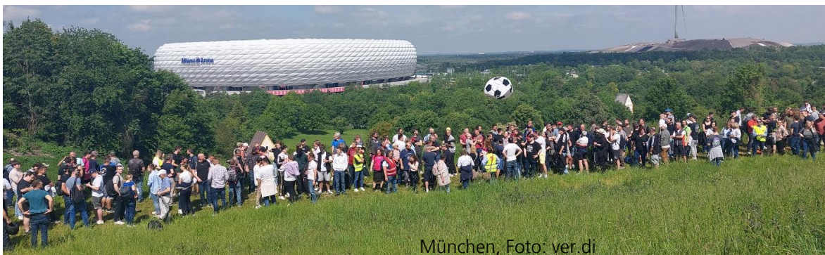
München, Foto: ver.di