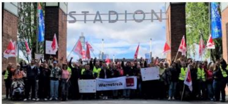
Köln, Foto: Nino-Pascal Bündgen